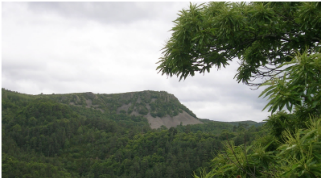
VUE SUR LA CHIROUSE - PRINTEMPS 2010 - PRANLES

L e 5 septembre 2014, le conseil municipal de Pranles a voté favorablement en vue de la création d'un parc éolien industriel sur la crête de la Chirouse à Pranles.